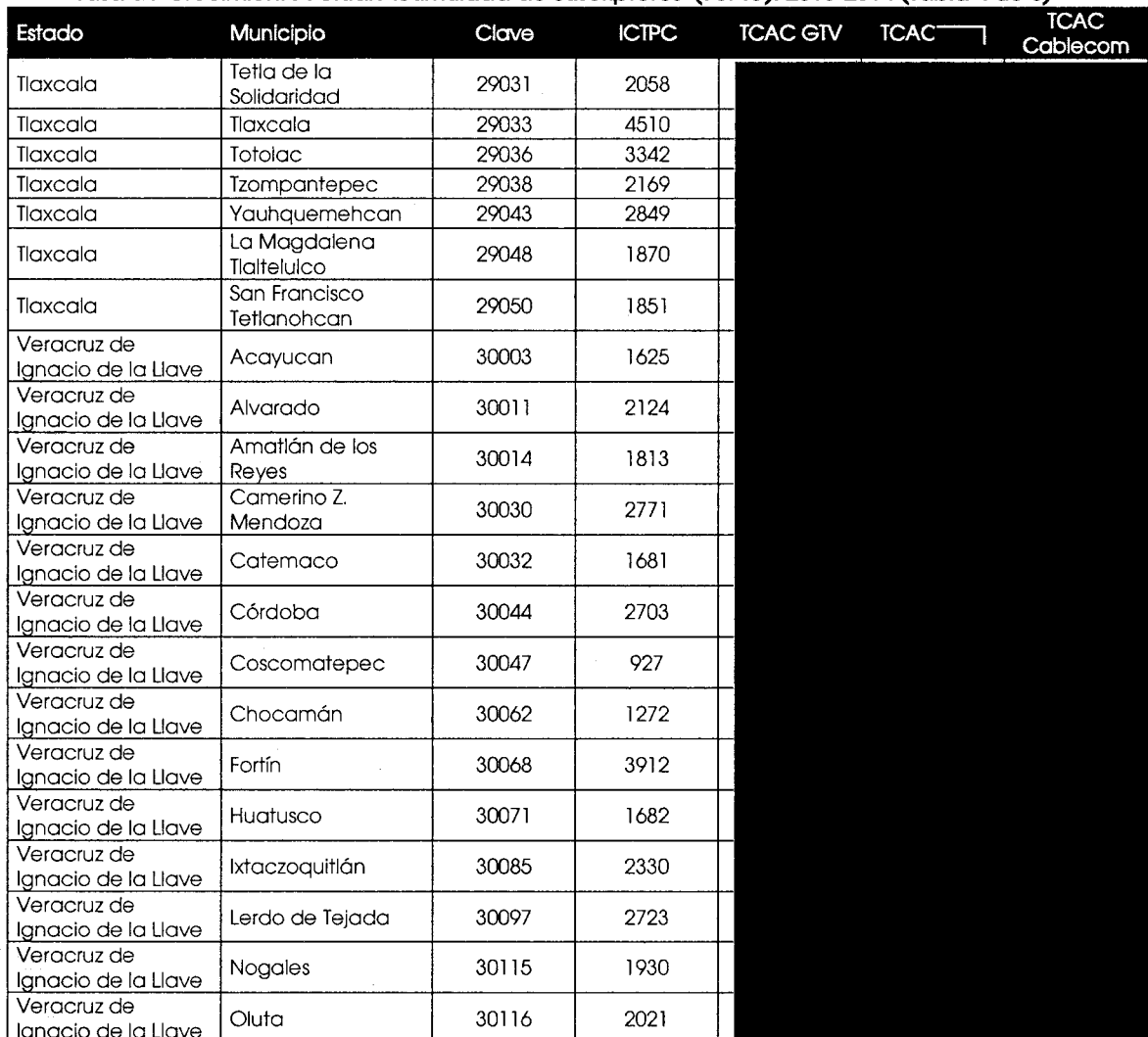
Ingreso Corriente Mensual Total per Cápita 2010 (ICTPC) y Tasa de Crecimiento Anual Acumulada de Suscriptores (TCAC). 2010-2014 (Tabla 4 de 5)

Fuente: Elaboración propia con base en información en las fojas señaladas en el Anexo XIV denominado "Índice de fojas de suscriptores" e información proveniente del Consejo Nacional de Evaluación de la Política de Desarrollo Social (CONEVAL). Foja: 10469.