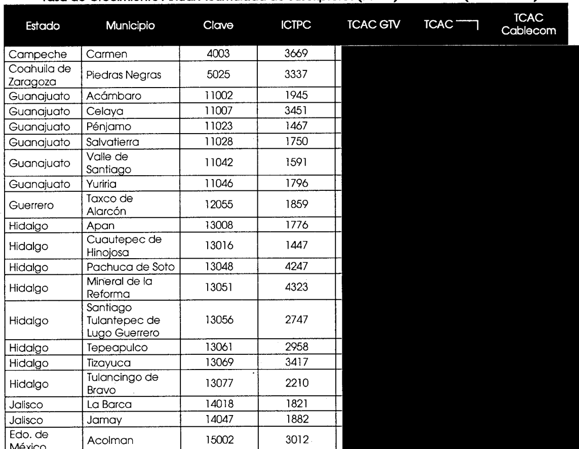
Ingreso Corriente Mensual Total per Cápita 2010 (ICTPC) y Tasa de Crecimiento Anual Acumulada de Suscriptores (TCAC). 2010-2014 (Tabla 1 de 5)

Fuente: Elaboración propia con base en información en las fojas señaladas en el Anexo XIV denominado "Índice de fojas de suscriptores" e información proveniente del Consejo Nacional de Evaluación de la Política de Desarrollo Social (CONEVAL). Foja: 10469.