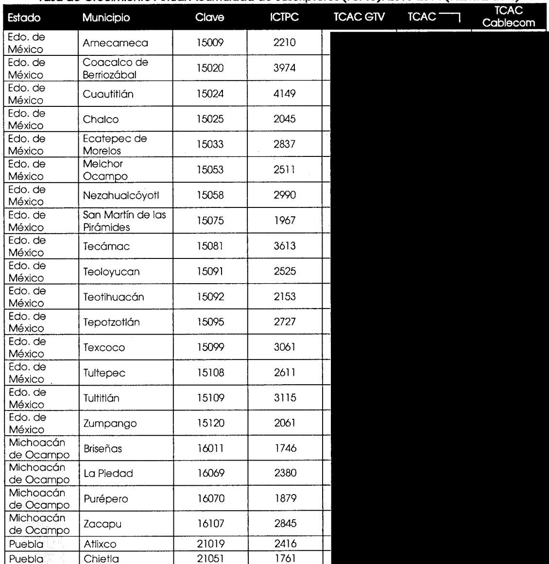
Ingreso Corriente Mensual Total per Cápita 2010 (ICTPC) y Tasa de Crecimiento Anual Acumulada de Suscriptores (TCAC). 2010-2014 (Tabla 2 de 5)

Fuente: Elaboración propia con base en información en las fojas señaladas en el Anexo XIV denominado "Índice de fojas de suscriptores" e información proveniente del Consejo Nacional de Evaluación de la Política de Desarrollo Social (CONEVAL). Foja: 10469.